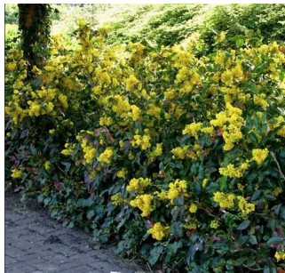
Mahonia (liane à baies)