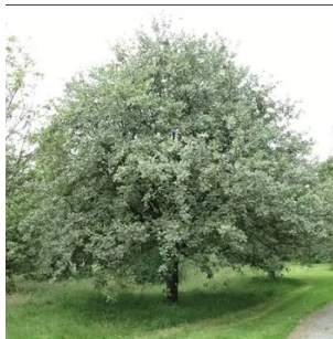
Alisier blanc (arbre à baies)